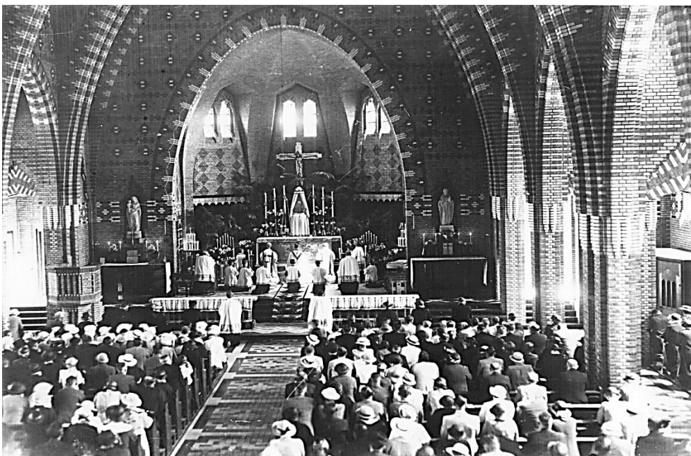
St. Franciscuskerk, mis 1935