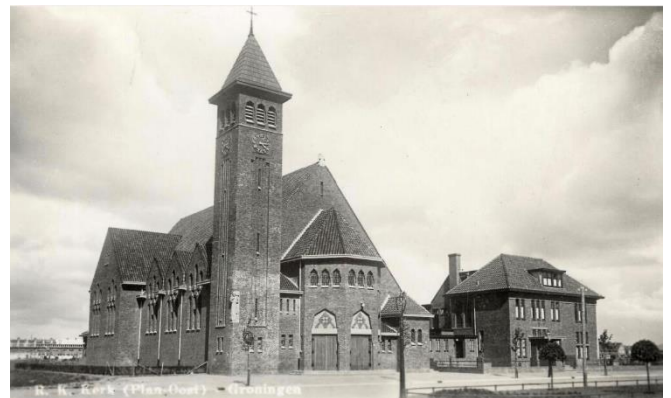
St. Franciscuskerk